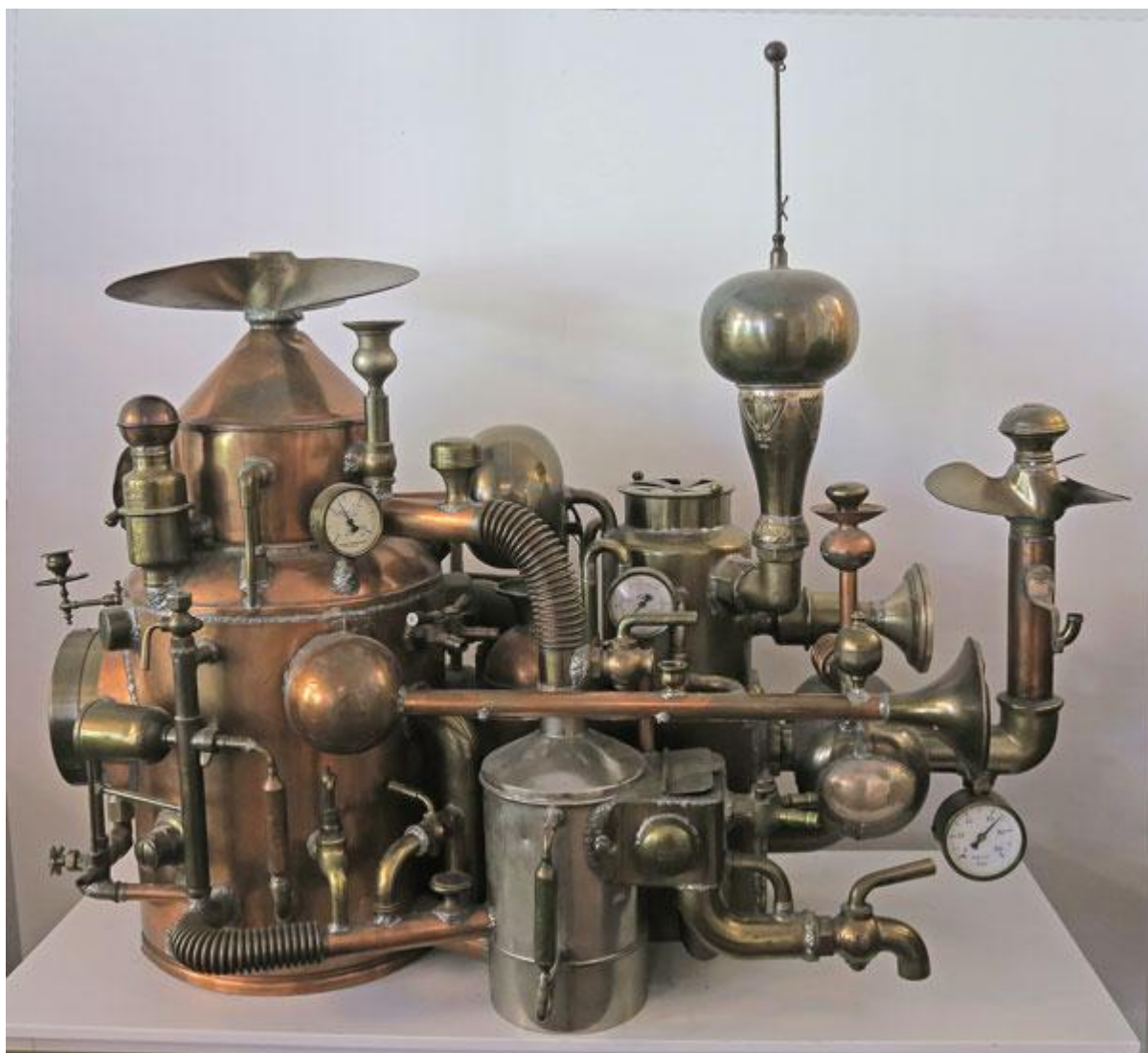
Placering: Dahlheimers hus. Märkt: BOSSE 76. Konstruktör: tyvärr okänd

Detta anses av många vara en helt normal radifikatör – andra hävdar å sin sida att den knappast kan ha fungerat som en sådan – vad anser Du?