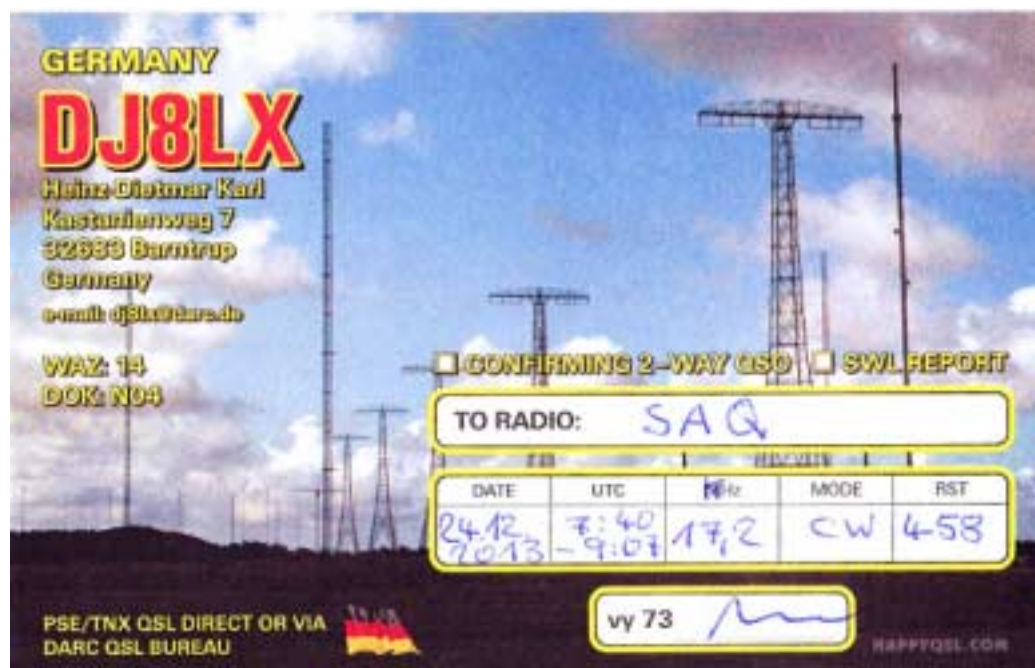
En tysk lyssnare gjorde sitt eget fina QSL-kort med bild på Grimetons vackra master