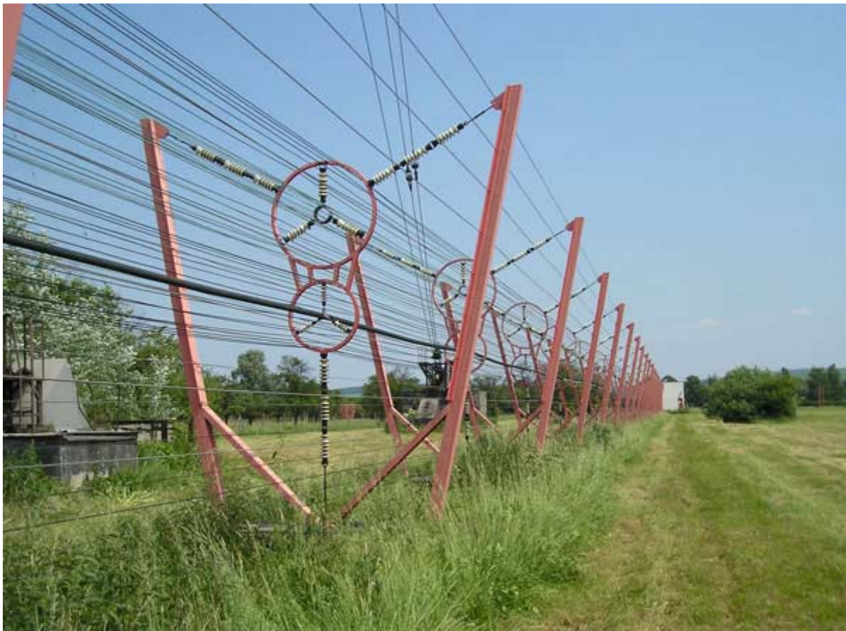
Öppen feeder från sändarhuset till antennerna.