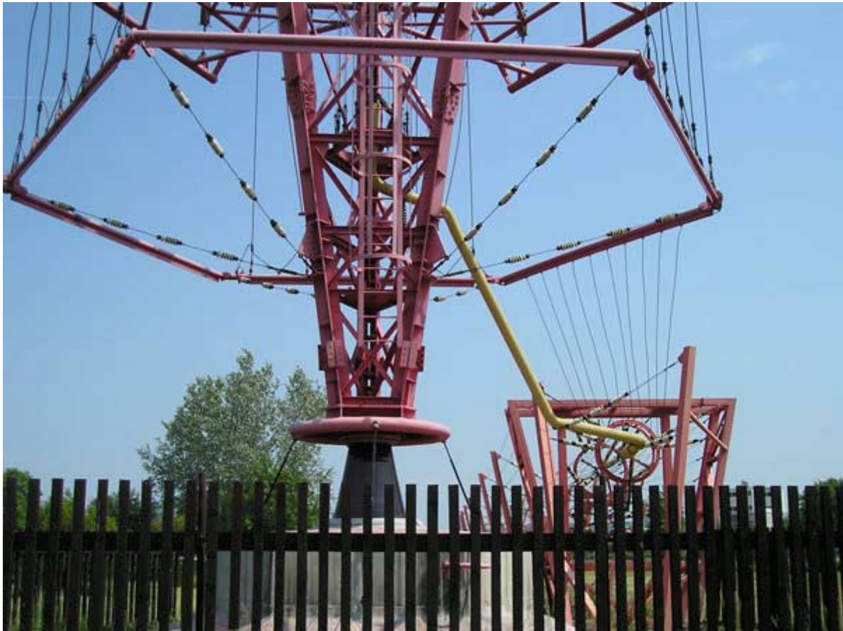
Den gamla och den nya antenmatningen