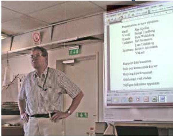
Bilder Lars Lindskog