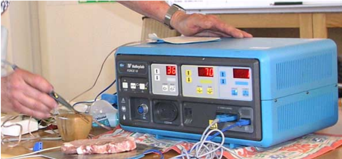
Vi fick skära i en ordinär fläskkotlett. Det fungerade utmärkt.