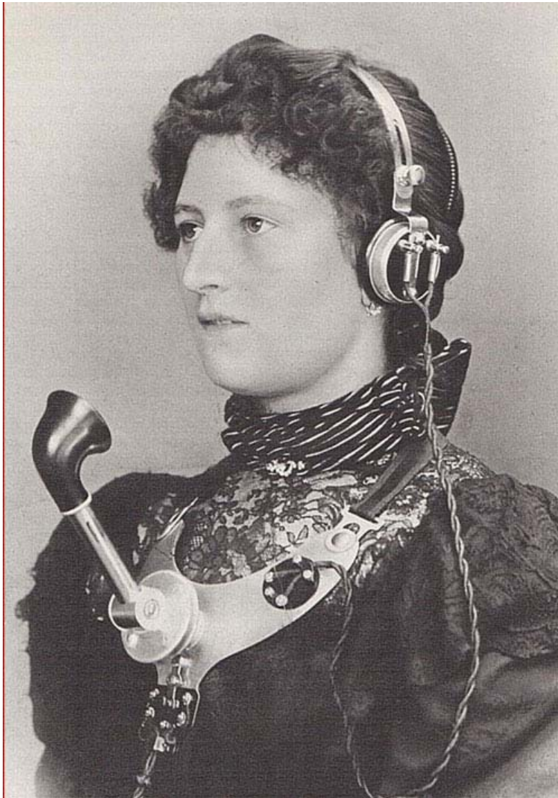
Handsfree för 100 år sedan omkring 1910