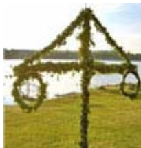
Varma midsommarhälsningar från Radiohistoriska Föreningen i Västsverige