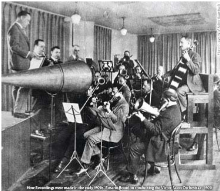
Man fick sitta lite trångt under inspelningar 1920

http://www.rcm.ac.uk/research/researchareas/pps/beethovenproject/